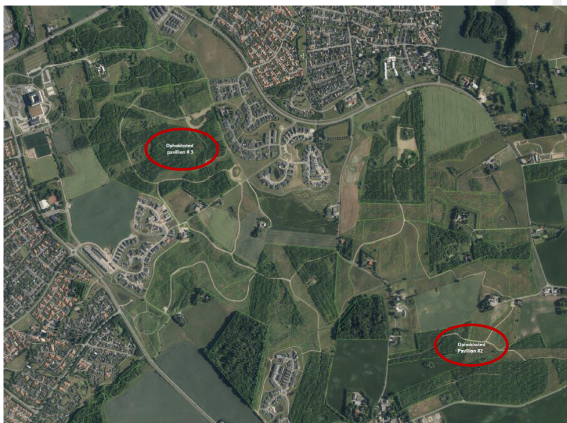
Oversigtskort, der viser placeringen af de to shelters/opholdssteder. Fra ansøgningsmaterialet.

Placeringen af de to shelters fremgår af kortet nedenfor.